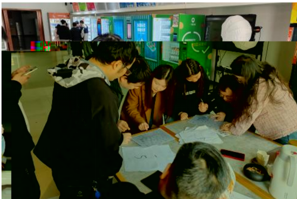
图 卓 团 建 共