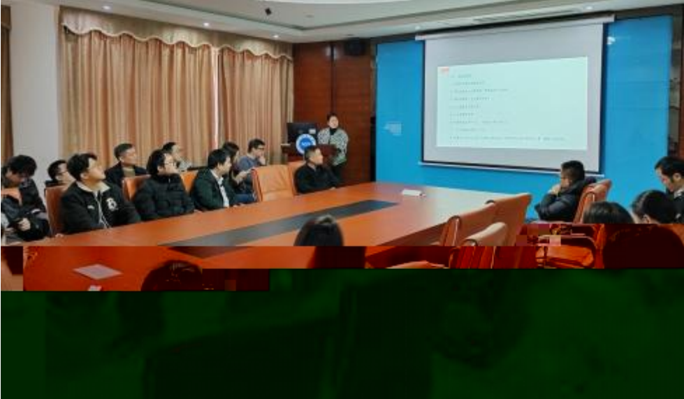
图 员工专业技 培