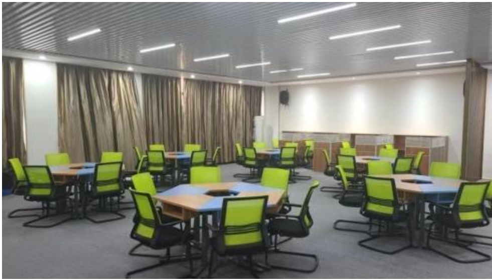
图 智慧 售 中心