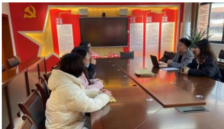
图 6-1 企开展学术 交 会